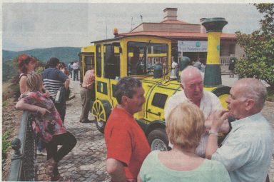
Los enólogos comerán en la bodega Regina Viarum tras el recorrido por las viñas. ALBERTO LÓPEZ

Para el presidente de la asociación gallega, esta visita permitirá a enólogos de diversas procedencias saber algo más