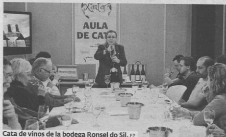
Cata de vinos de la bodega Ronsel do Sil.

Hoy, con el fin de persuadir al potencial consumidor de que los Ribeira Sacra marinarán perfectamente con cualquier menú, la