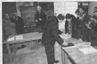
Varias personas consultan el proyecto en la Casa de la Cultura. TORO PEREIRA

INICIATIVA DEL BNG. El BNG se sumó también a la iniciativa de otros partidos, al igual que PP y PSOE, de poner en su sede a disposición de los vecinos de Monforte técnicos capaces de aclarar dudas sobre el documento urbanístico.