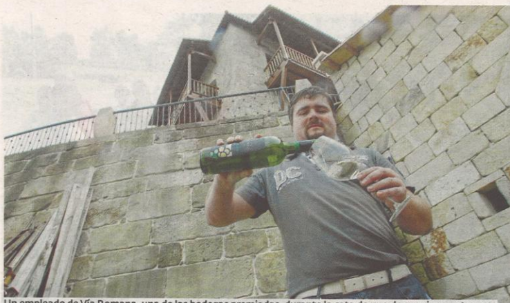
Un empleado de Vía Romana, una de las bodegas premiadas, durante la cata de uno de sus vinos.