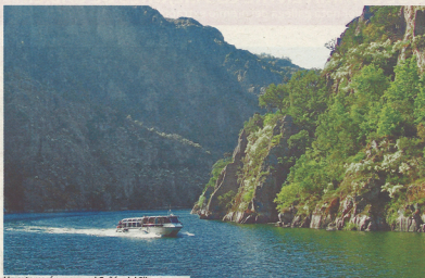
Un catamarán recorre el Cañón del Sil.

La segunda vía consiste en una queja abierta o petición en forma de informe que se envía al organismo de Derechos Humanos de la Unesco. En esa queja el Valedor expresa la necesidad de proteger el patrimonio cultural e inmaterial y aporta documentación en ese sentido. Estas gestiones podrían dar sus frutos en unos meses, se