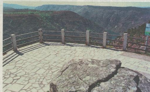
Este era hasta hace poco el aspecto del mirador de Cadeiras. C. RUEDA