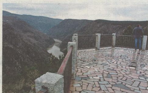
En Santiorxo había antes una plataforma de hormigón. ALBERTO LÓPEZ