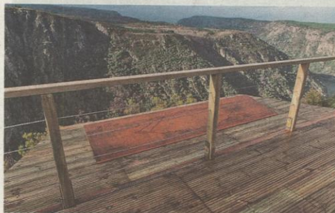
Un plano de la zona en una placa metálica en Cadeiras.