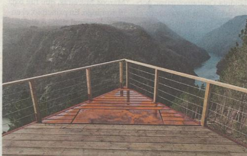
Parte delantera del nuevo mirador de Santiorxo.