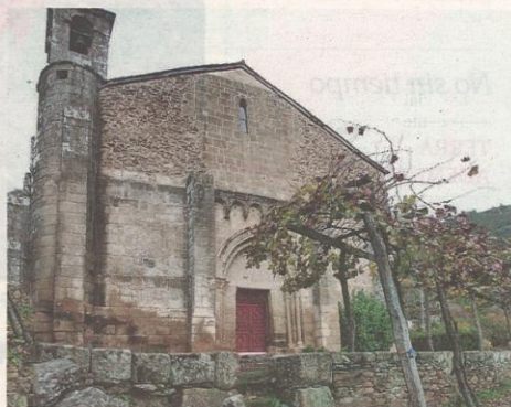
La cata tendrá lugar en la iglesia románica de Pombeiro.